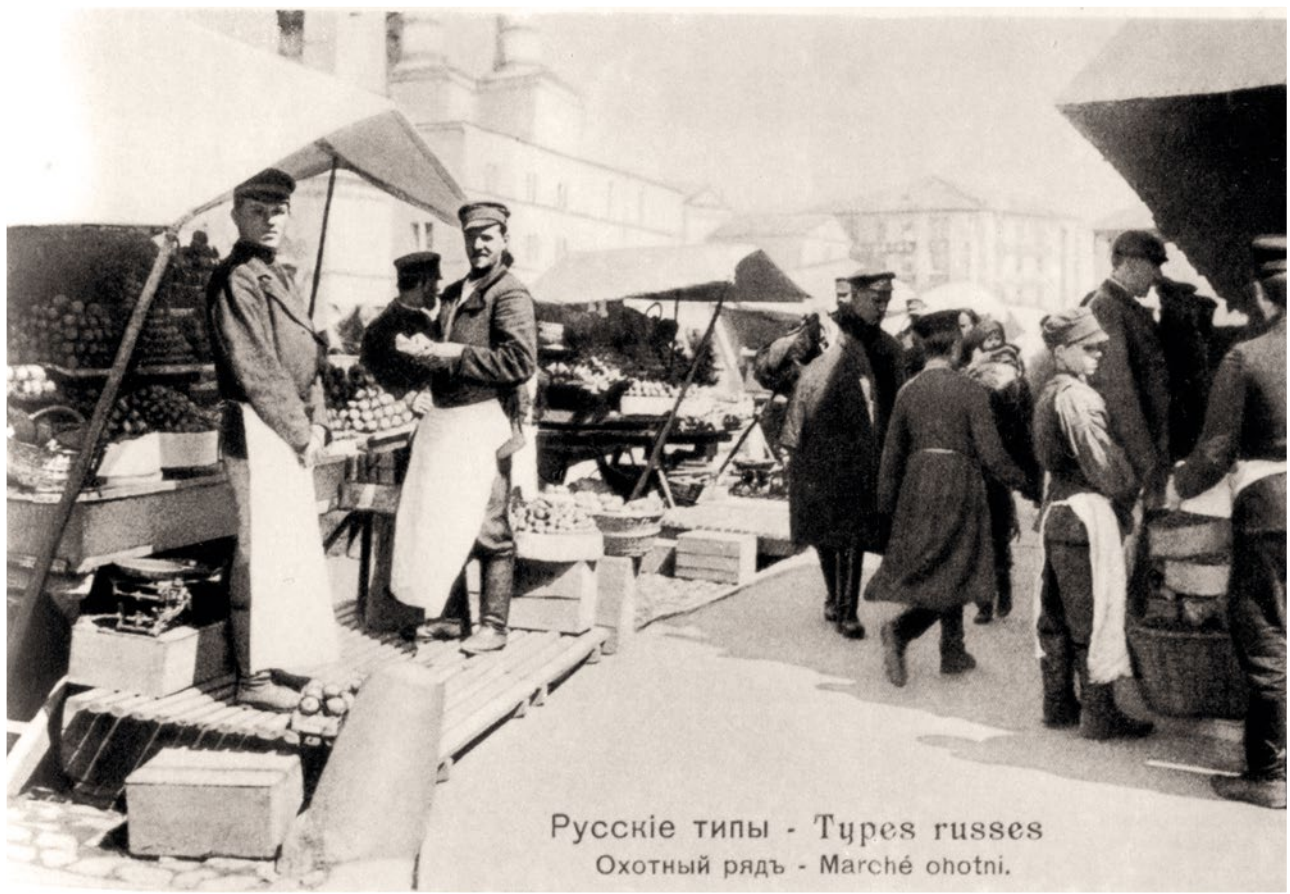
Русские типы - Types russes Охотный рядъ - Marché ohotni.

Осмотрев лавки, комиссия отправилась на Монетный двор. Посредине его — сорная яма, заваленная грудой животных и растительных гниющих отходов, и несколько деревянных срубов, служащих вместо помойных ям и предназначенных для выливания помоев и отходов со всего Охотного ряда. В них густой массой, почти в уровень с поверхностью земли, стоят зловонные нечистоты, между которыми